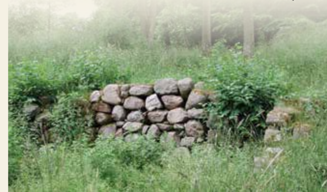
Resterne af Stampemøllen

Området der er skraveret på kortet er udpeget til forstyrrelsesfrit område, især for hjortevildtet. Der er opsat to platforme ved P-pladsen ved Gillelejevej. Herfra kan man betragte de dyr, der trækker ud af skoven for at græsse på de åbne arealer.