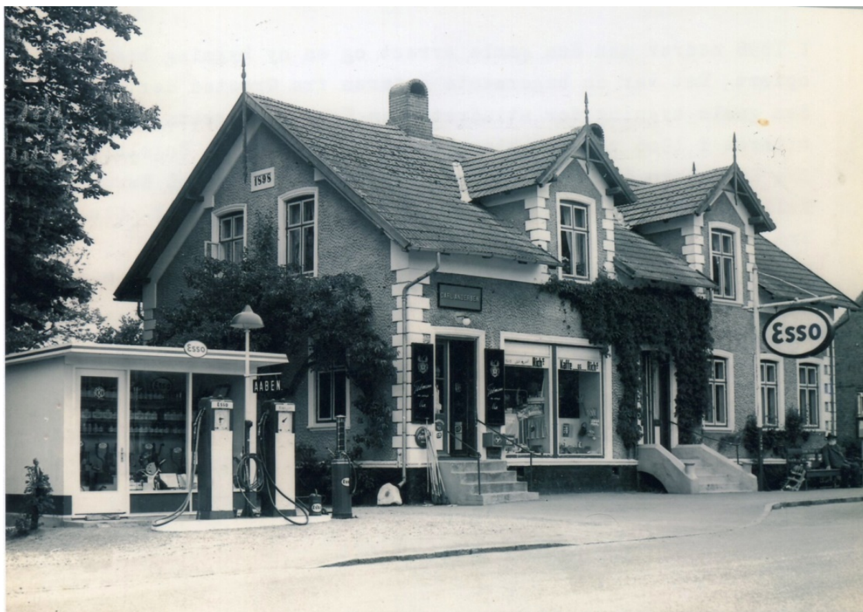
Esum Købmandshandel på hovedgaden overfor kroen i 1950'erne