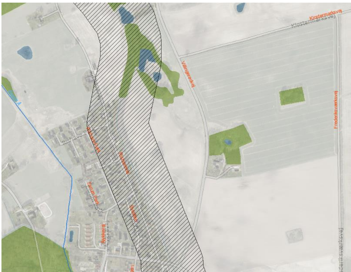
Figur 1: Skraveret område er beskyttelseslinje