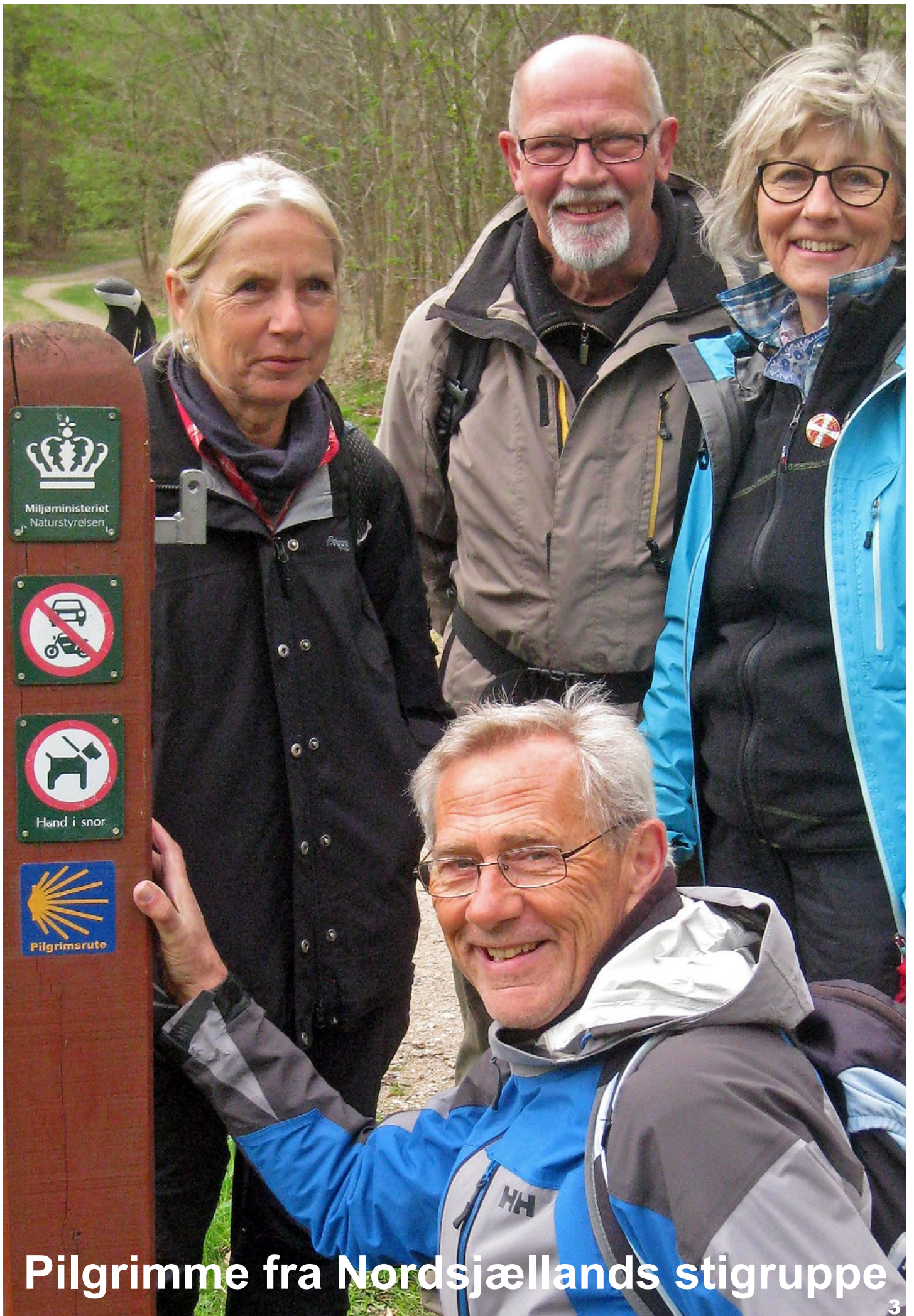
Pilgrimme fra Nordsjællands stigruppe