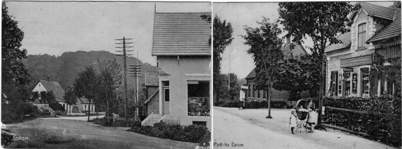
De to købmandshandler på Esrum Hovedgade i midten af 1900 tallet